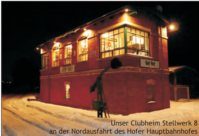
Unser Clubheim Stellwerk 8 an der Nordausfahrt des Hofer Hauptbahnhofes

Einen herben Rückschlag erlitt der Verein, als durch Brandstiftung der Clubraum am Q-Bogen mitsamt der Modellbahn-Anlage ein Raub der Flammen wurde. Der oder die Täter konnten leider nie ermittelt werden und der MEC mußte von vorn beginnen. Aber die Hofer Modellbahner ließen sich nicht unterkriegen und so entstand die heute etwa 80m 2 große Modellbahn-Anlage in einem wesentlich größeren Clubraum.