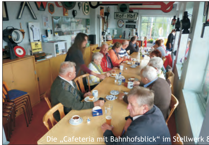
Die „Cafeteria mit Bahnhofsblick“ im Stellwerk 8

In der warmen Jahreszeit ist das Clubheim Stellwerk 8 jeweils am ersten Sonntag im Monat ab 10 Uhr Treffpunkt zum MEC-Frühschoppen.