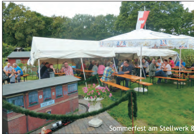
Sommerfest am Stellwerk 8

Zweimal jährlich locken Sommerfeste beim Clubheim Stellwerk 8 zahlreiche Eisenbahnfreunde an. Gemütlich geht es dann in der „Cafeteria mit Bahnhofsblick“ zu, von wo aus sich für die Fotografen ein vorzüglicher Standort bietet, die vorbeifahrenden Züge zu fotografieren. Deftiges vom Holzkohलगrill sowie das süffige Hofer Bier gibt es im „Biergarten mit Gleisanschluß“, zu dem so mancher vorbeifahrende Lokführer einen „pffiffigen“ Gruß schickt.